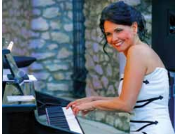
WIR DANKEN DER FIRMA „DER REISINGER“, 1090 WIEN

Konzert: 26. August 2011 um 20.00 Uhr, Kartenpreise: € 22,- / € 33,- / € 44,- Gefördert von: art-event-creation